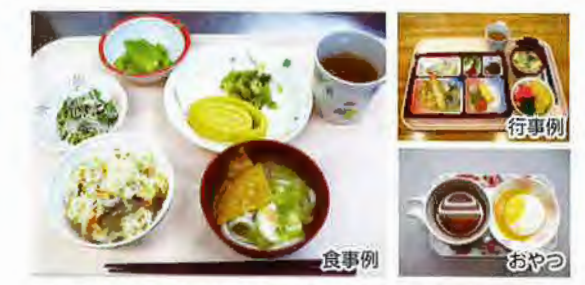
季節料理や誕生日特別料理など楽しみあふれる食事もあります。

心豊かに健康を維持していただけるよう毎日の食事でも充実しています。また、入居者の状態に応じて、普通食・キザミ食・ミキサー食・とろみ食等の食事を提供しています。